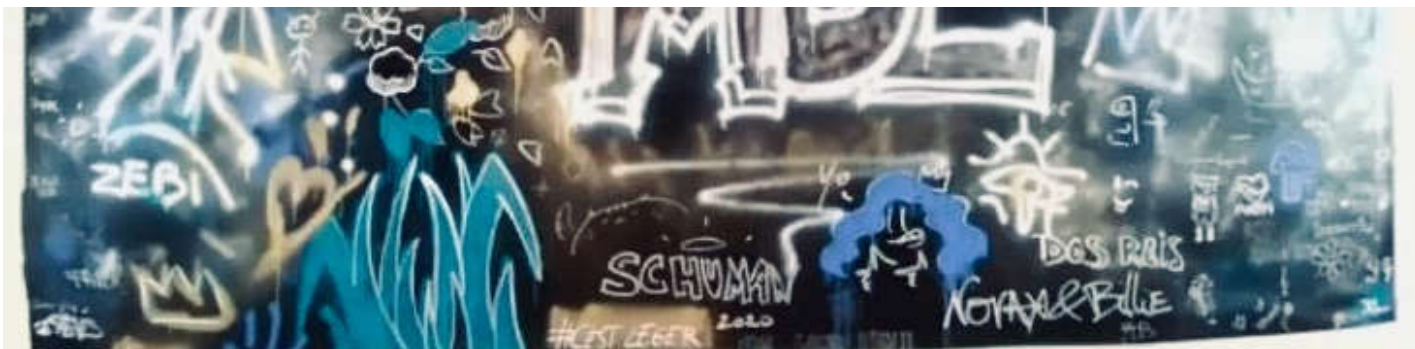
Fresque réalisée par des élèves et des personnels dans la salle MDL pendant la journée Portes Ouvertes 2020

la newsletter du lycée Robert Schuman de Charenton-le-Pont